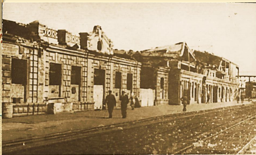
Внешний вид Ростовского вокзала с перрона.

« За время зимнего наступления наша Красная Армия освободила территорию в 480 тысяч квадратных километров. Десятки городов, тысячи сел снова стали Советскими и над ними свободно реет наше славное знамя Победы!...»